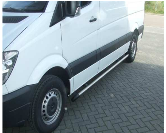
BM en BC series