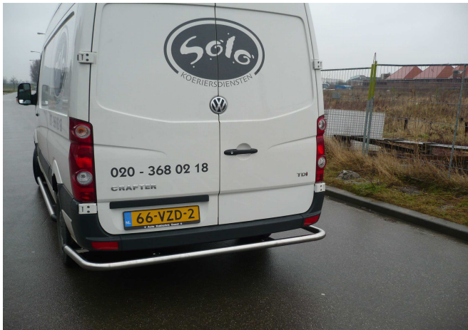
Achterbar om de hoek