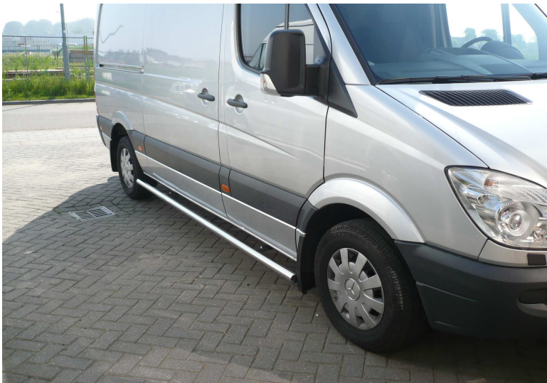
RM en RC series