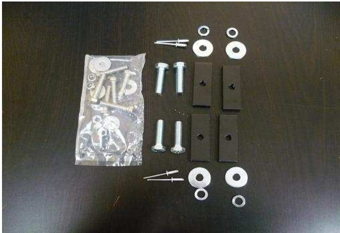
Kit for L1 L2

Montage hulp Sprinter-Crafter L1 43series = 1300Orion60-001 Montage hulp Sprinter-Crafter L2 44series = 1300Orion60-002 Montage hulp Sprinter-Crafter L3 45series = 1300Orion60-003