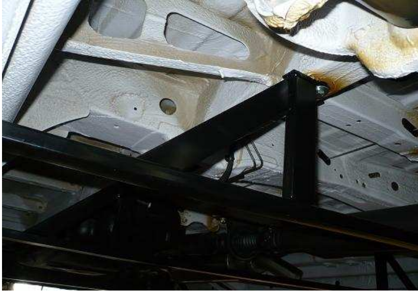
#2 Links achter. Gebruik de originele gaten, en de M10 plaat groot