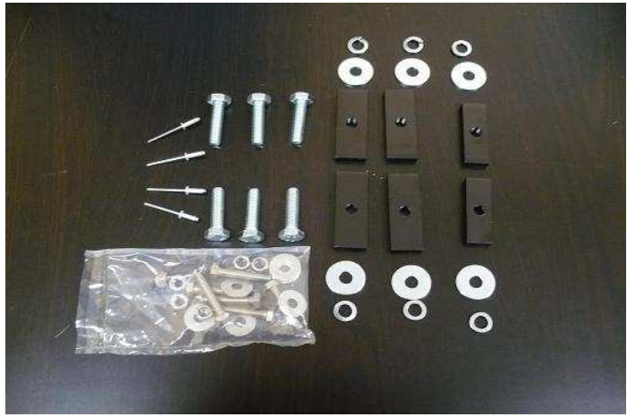
Kit for L3