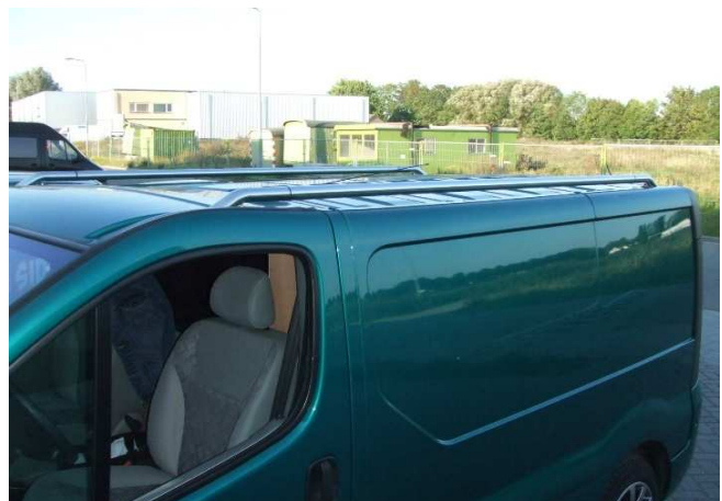
RVS Dak rails 0031736448521 INFO@ORIONAUTOMOTIVE.COM