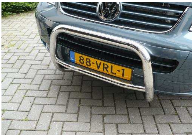
Pushbar met EC keur info; WWW.ORIONAUTOMOTIVE.COM