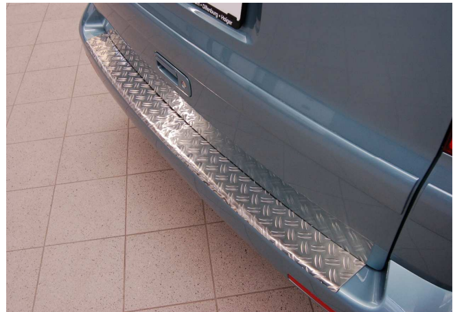
Alu bumper beschermer