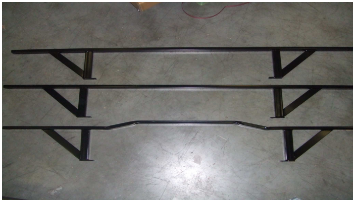
3 steunen voor L3